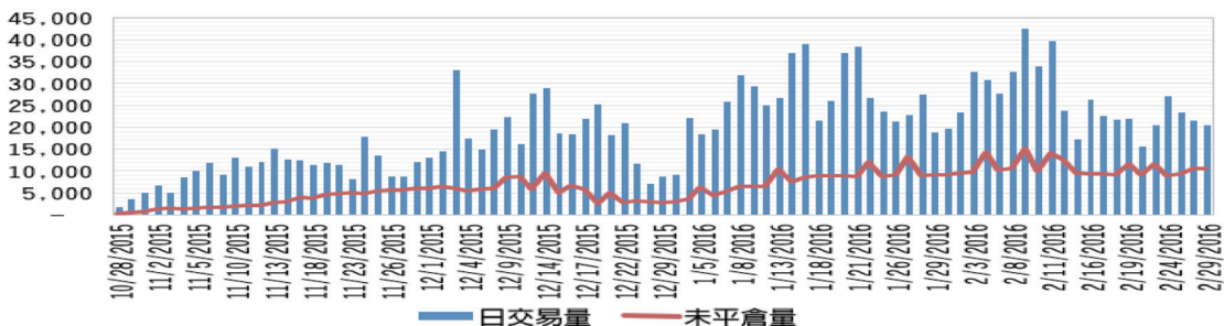
圖 2：小型德國指數期貨交易量

推出以來，小型德國指數期貨受到投資者的大力支持，成交量與未平倉量不斷攀升（如圖 2 所示），截至 2016 年 2 月，每日成交量已順利突破兩萬口的水平，並預計將持續成長，顯示該商品已具備充分的流動性且仍有相當大的潛能。而小型德指期貨將於今年 4 月底上市達六個月，屆時將正式提交台灣主管機關審核，一旦經主管機關同意通過並公告後，台灣的一般投資者便能透過國內期貨商交易該檔商品。